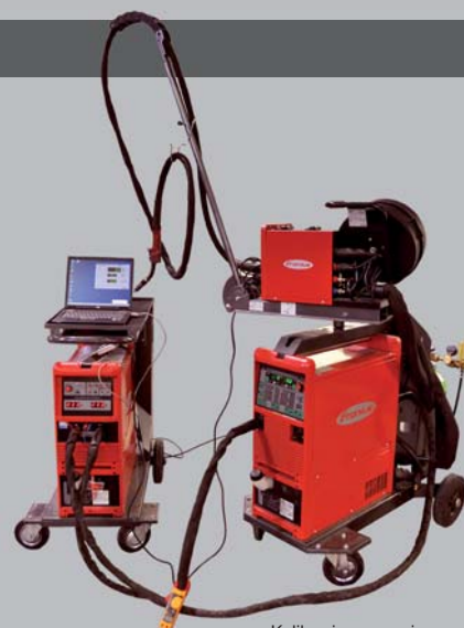
Kalibrering av sveiseapparater

E-post: verksted@rakkestad-sogneselskap.no