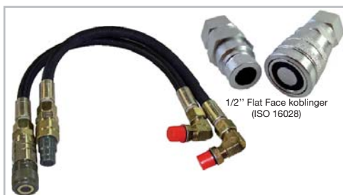
1/2" Flat Face koblinger (ISO 16028)

Hydraulisk slangesett med 1/2" Flat Face koblinger (ISO 16028) for Spitznas borhammere. Passer modeller med 1/2" BSP/BG2 gjenger.